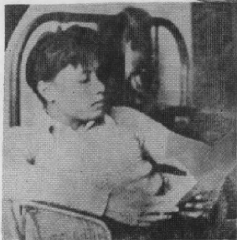
艾思奇同志在上海 (1932—1937年)